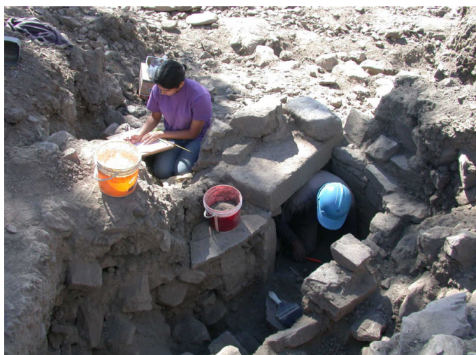
Figura 5. Excavación de la Tumba 5 en La Banda, Gaucho.