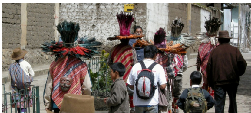
Figura 7. Bailarines de wishkur danza en el Distrito de Chavín, Ancash.

Los tiempos recientes en Chavín han sido marcados por la conjunción de la modernidad con los esfuerzos individuales o colectivos por conservar las tradiciones locales. Esto último es reflejado con éxito en la popularidad ganada por el wishkur danza (danza del halcón), un baile ejecutado varias veces al año por los varones de las comunidades de Chichucancha, Jato, y Lanchán pero también por entusiastas chavininos (Figura 7). El wishkur danza refleja un interés renovado en la historia y conocimientos locales, siendo realizado en ocasiones como la inauguración de nuevos locales, festividades anuales o el homenaje a los santos patronos. En cada instancia, su performance no refleja una simple representación teatral sino la participación activa de pobladores que asumen con vitalidad las tradiciones locales y los retos del presente.