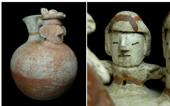
Figura 6. Vasijas recuay de la Tumba 5 (fotos: Jorge Gamboa, 2009).