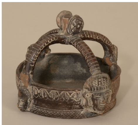
Figura 11. Objeto de barro con réplicas de cabezas teotihuacanas y malacates posclásicas (Museo de Etnografía, N° de inv.: 65.1.28).

Como hemos visto, Horti aplicó el mismo método que habían utilizado los profesores húngaros de arte al estudiar el arte popular de Hungría, excepto que Horti, en tanto que también era un calificado alfarero, dominaba la técnica de fabricación de vasijas de barro e igualmente aplicó este conocimiento para arribar a sus erróneas conclusiones. Partiendo únicamente de motivos externos y formales supuso conexiones entre fenómenos culturales distantes en tiempo y espacio. Sobre la base de esas observaciones superficiales concluyó que la similitud formal y tecnológica de objetos hechos en diferentes lugares habilitaba a conectar el origen de la etnia húngara con culturas lejanas, poniendo en el centro de