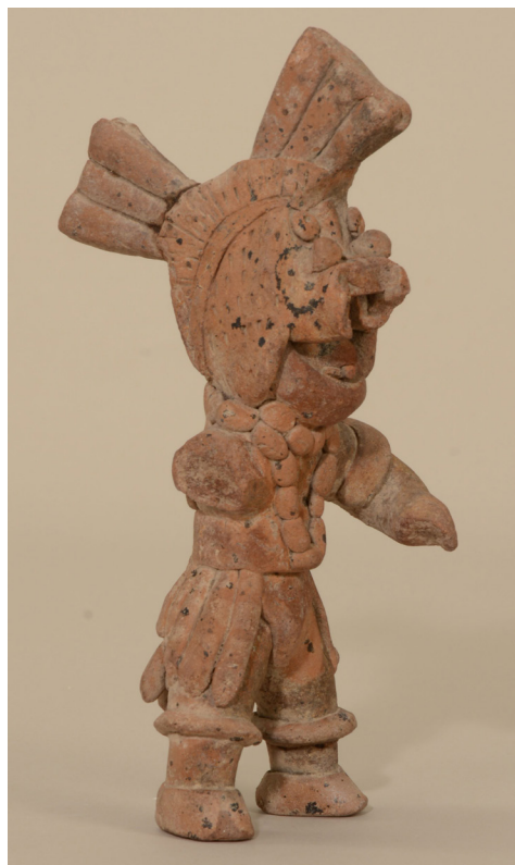
Figura 8. Figura de barro, probablemente de Colima (Museo de Etnografía, N° de inv.: 119303).