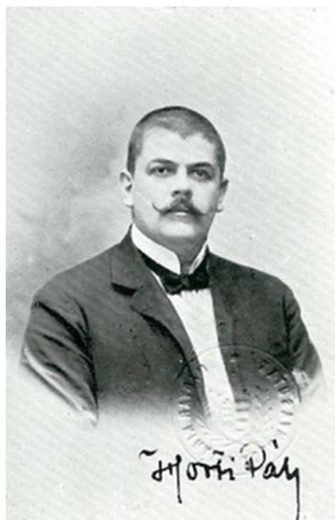
Figura 1. Fotografía de Pál Horti (Anónimo 1907: 171).

Horti (originalmente Hirth, véase Figura 1) nació en 1865 en Pest, Hungría, y fue un pionero del Art Nouveau en Hungría con una notable producción en casi todas las