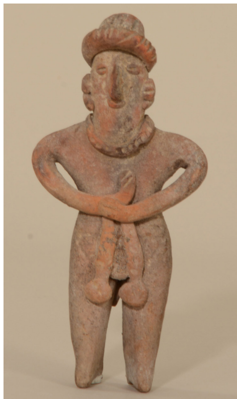
Figura 9. Figura de barro, probablemente de Colima (Museo de Etnografía, N° de inv.: 119302).

adquirido en Tlacotepec, pertenece al estilo Mazapán, fechado en la primera fase de la época posclásica; otro cuenco policromado del estilo Mixteca-Puebla fue adquirido por Horti en Acatzingo (Figura 7). Al mismo tiempo se desconoce la procedencia de los hallazgos de México occidental. Es posible que Horti no haya visitado personalmente los sitios donde se excavaron estas piezas y las haya comprado a coleccionistas o comerciantes de arte. A pesar de las circunstancias de la adquisición, estas vasijas y figurinas representan la mejor parte de la colección Horti, sobre todo un guerrero/danzante con tocado de plumas del período preclásico tardío (200 a. C. - 300 d. C., Figura 8) y una figurina femenina de elaborado peinado (Figura 9).