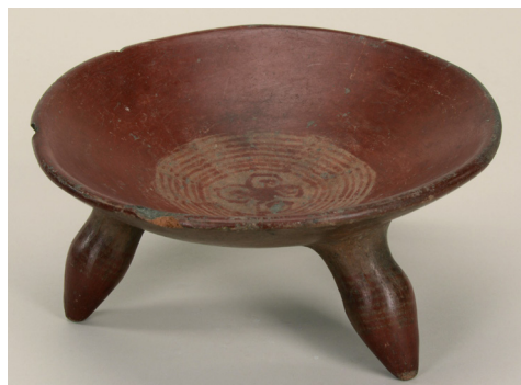
Figura 6. Cuenco de estilo Mazapán de Tlacotepec (Museo de Etnografía, N° de inv.: 65.1.22).

Museo de Artes Aplicadas, los comentarios escritos por Horti sobre los objetos, y por último las características estilísticas de estos. Los tres puntos de referencia indican que la colección procede de dos regiones: centro y occidente de México. Los hallazgos procedentes de México occidental pertenecen al período Preclásico Tardío y Protoclásico, mientras que los de los estados de México y Puebla pertenecen a culturas clásicas y sobre todo posclásicas; en los libros de inventario o en algunos de los objetos se menciona solamente el yacimiento del caso y se indica que Horti había conocido solo la procedencia de estas piezas. 18 Analizando estos topónimos se advierte que la mayoría de los hallazgos proceden del estado de México y los demás proceden de Texcoco, Toluca y Puebla, lo que sugiere que habrían sido adquiridos por Horti en estas poblaciones en las excursiones por él realizadas desde Ciudad de México, y no comprados a otros coleccionistas. La procedencia local de las piezas del centro de México la corroboran también sus rasgos estilísticos. Por ejemplo, un cuenco trípode con pintura roja (Figura 6)