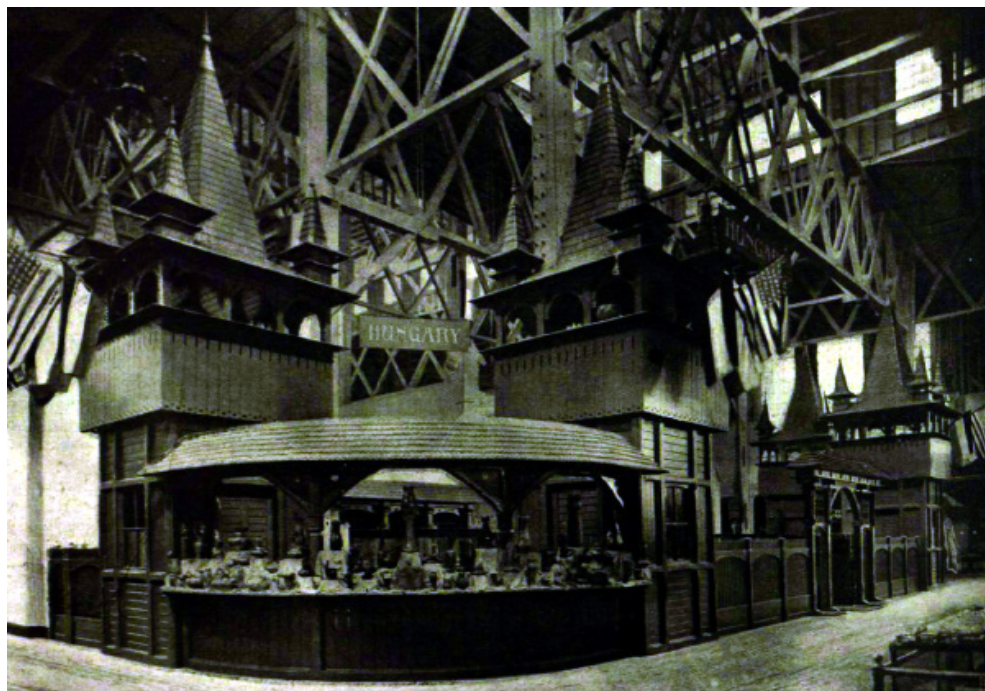
Figura 3. Pabellón húngaro en la Exposición Universal de St. Louis en 1904 (Úrmánczy Nándor 1904: 660).

ramas de las artes plásticas, desde el diseño de muebles y la organización de exposiciones, hasta las artes gráficas y del libro. Además aprendió alfarería, incluyendo la preparación de barnices y la cocción de vasijas de barro (Anónimo 1907: 172. Véase Figura 2), competencia que le sería de gran utilidad en las investigaciones que realizaría más adelante en los Estados Unidos y México. Se había formado en la Escuela Real Húngara de Artes Decorativas, instituto antecedente de la Universidad de Bellas Artes, y empezó su carrera docente en la Escuela de Artes Aplicadas (Koós 1982: 17-18).