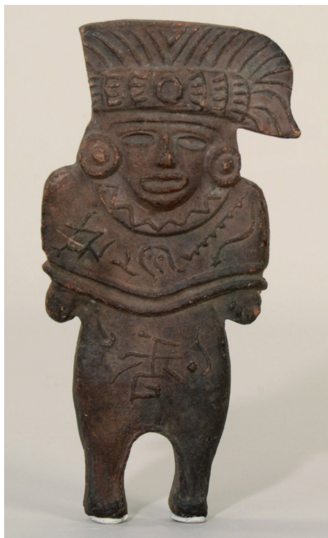
Figura 10. Falsificación con rasgos teotihuacanos (Museo de Etnografía, N° de inv.: 70.70.53).

en molde, similarmente a las copias de yeso, pero no por Horti, sino más bien adquiridas en el mercado del arte, si tomamos en cuenta su anverso (Figura 10). Mientras su rostro fue plasmado en forma de una máscara del estilo teotihuacano, en su pecho y vientre lleva la imagen espejular del mismo signo de puntuación chino que significa fragancia (香). Posiblemente se trata de un souvenir fabricado en molde y por eso aparece la imagen espejular del signo de puntuación. Considerando que Horti permaneció solo seis días en China, el objeto pudo haber sido conseguido en México.