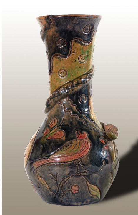
Figura 2. Jarra diseñada por Pál Horti en los años 90 del siglo IX. Owner: Kecskemét Katona József Múzeum, Inv. No.: 92.7. IP.