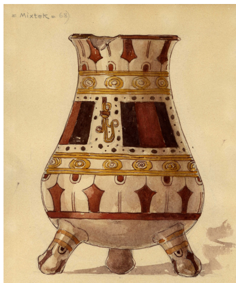
Figura 5. Acuarela de Horti. Representa una vasija mixteca (Museo de Artes Aplicadas, N° de inv.: MLT 262).