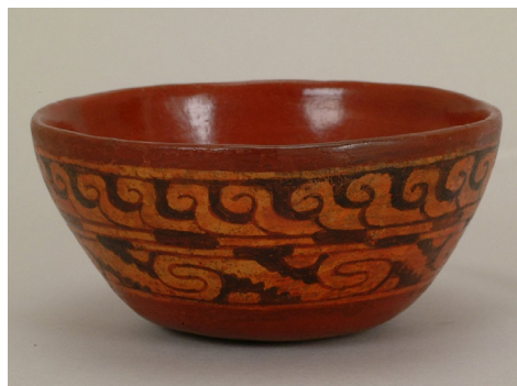
Figura 7. Cuenco de estilo Mixteca-Puebla de Acatzingo (Museo de Etnografía, N° de inv.: 65.1.26).