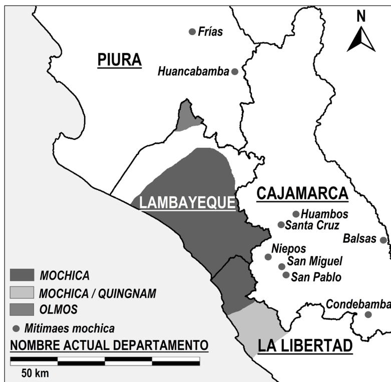
Figura 2. Extensión del mochica en 1643 según Carrera (1939 [1644]) (mapa: elaboración propia).